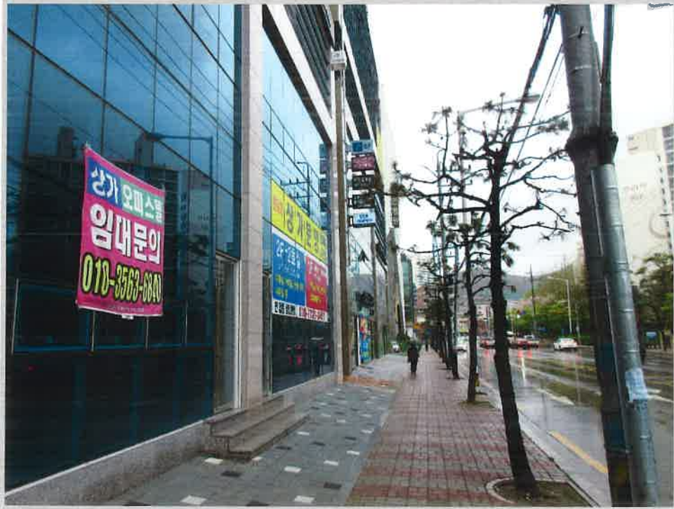
[본건 전경 및 주위환경]