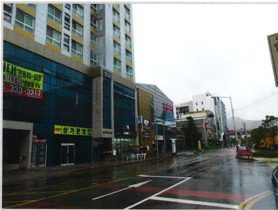
[본건 전경 및 주위환경]